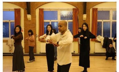
莎莎舞教学与联谊